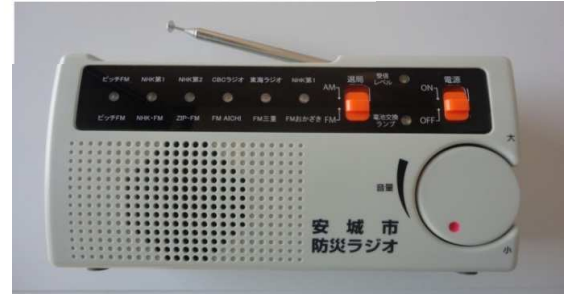
大きさ：横幅20cm × 高さ10cm × 奥行7cm